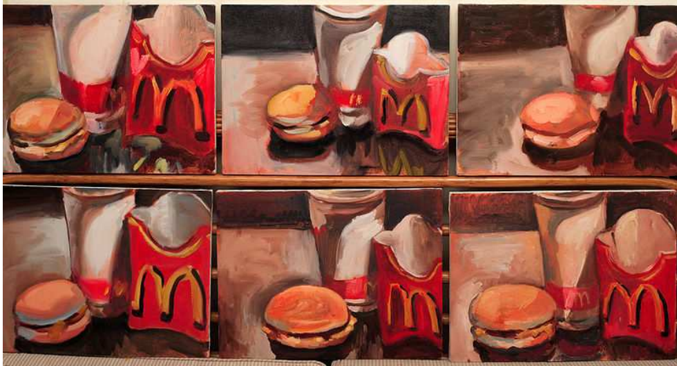
Peter Klashorst (peintre allemand), Find the differences