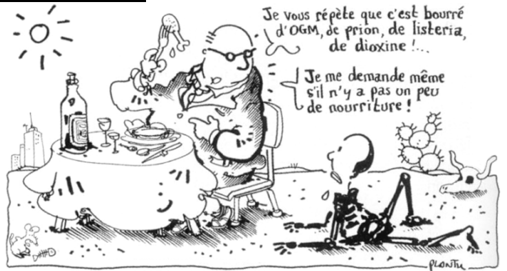
▲ Plantu in Le Monde , janvier 2002