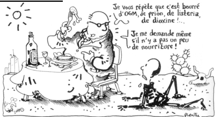
▲ Plantu in Le Monde , janvier 2002